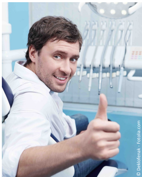
Gesunde Zähne in jedem Lebensalter dank regelmäßiger Professioneller Zahnreinigung