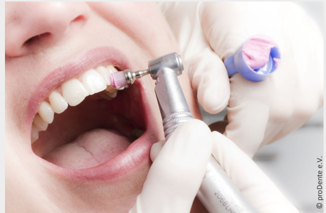
Die Professionelle Zahnreinigung wird von speziell ausgebildeten Prophylaxe-Fachkräften ausgeführt und ist eine lohnende Investition in die eigene Gesundheit.

Sie ersparen sich oft Kronen, Implantate und Zahnfleischoperationen.“