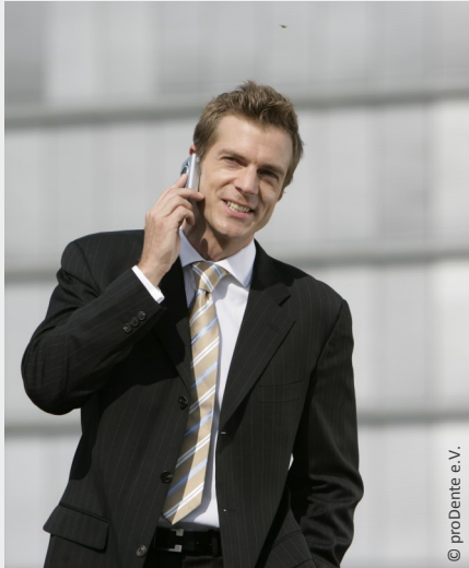
Selbstsicher mit gepflegten Zähnen

Dann werden Mund, Zähne und Zahnfleisch untersucht. Die Zahnbeläge werden angefärbt, um sie besser sichtbar zu machen und es wird die Tiefe der Zahnfleischtaschen gemessen.