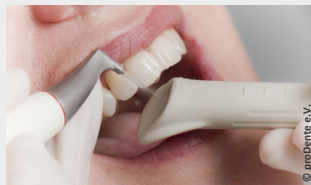
Zahnreinigung mit Pulverstrahlgerät

Auch wer seine Zähne regelmäßig und sorgfältig putzt, erreicht nicht alle Zahnoberflächen. Das sind vor allem die Stellen unter dem Zahnfleisch, in manchen Zahnzwischenräumen und die sehr feinen Grübchen auf den Kauflächen.