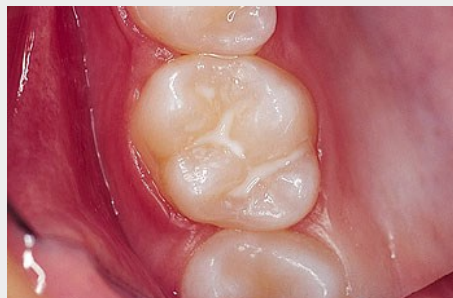
Schutz vor Karies: Versiegelung der feinen Grübchen auf der Kaufläche

Bei der Versiegelung werden die Fissuren mit einem hellen Kunststoff dauerhaft verschlossen, so dass an diesen Stellen keine Karies mehr entstehen kann (siehe Abb. unten).