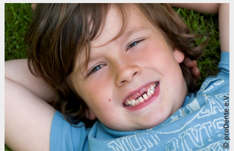
Bei der Prophylaxe lernen Ihre Kinder die richtige Zahnpflege

Es gibt also keinen Grund, warum Sie auf Prophylaxe für Ihre Kinder verzichten sollten.