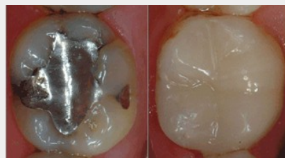
Bedenkliches Amalgam (links) oder verträgliche und ästhetische Füllungen aus Komposit oder Keramik (rechts)?

Als Kassenpatient haben Sie die Wahl zwischen Amalgam und kurzlebigen Kunststoff-Füllungen. Wenn Sie eine dauerhaftere und schönere Lösung wollen, sollten Sie sich für Kompositfüllungen oder für Keramikinlays entscheiden.