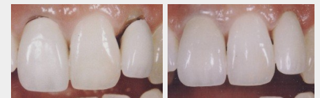
Metallkeramik-Kronen mit dunklen Rändern (links) und ästhetische Kronen aus reiner Keramik (rechts).

Wenn Sie wirklich schöne Zähne wollen, sollten Sie sich für Kronen und Brücken aus reiner Keramik entscheiden.